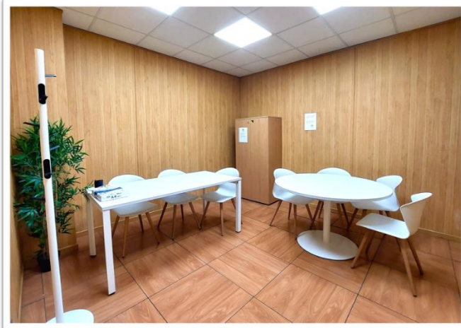
Oficina Juzgado de lo Social

Togas: Acceso a oficina en los Juzgados de lo Social con armario de togas disponible.